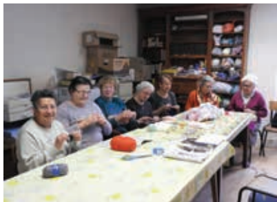
Réunion du café-tricot

A u cours de l'année écoulée, une adhérente très dynamique de l'association locale a eu l'idée de créer une rencontre hebdomadaire : un « café-tricot ». Un lieu, un jour sont définis et, petit à petit, le groupe se crée.