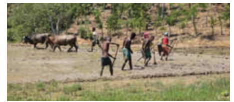
Préparation des rizières