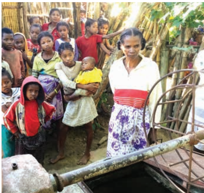
Puits de Manakana, commune de Mananjari

Notre mission de mai 2017 nous a permis de découvrir, face aux réalisations, des problèmes auxquels nous n'avions pas pensé : l'ignorance du simple fonctionnement d'une pompe à eau ou l'absence complète de matériel de réparation.