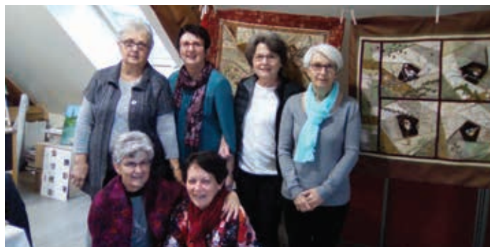
Au club des mains créatives de Vuillecin

Cette demande a reçu un accueil très favorable, sous forme d'un chèque de 500 €.