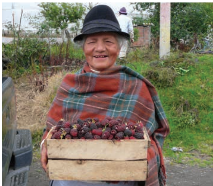
Villageoise de Pachanillay avec sa récolte de mûres