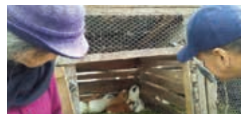
Elevage de cochons d'Inde

L'élevage des cochons d'Inde , plat apprécié en Equateur, se poursuit aussi . Les bâtiments qui abritent ces animaux ont été améliorés et des mâles d'une race péruvienne ont été achetés et remis aux bénéficiaires afin d'améliorer la reproduction. Une herbe fourragère, la marafalfa, de meilleure qualité que celle utilisée précédemment a été semée près des maisons à l'intention de ces animaux.