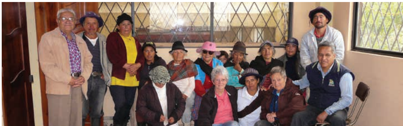
Villageois de Pachanillay