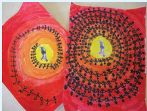
Dessin de la classe de CP, Ecole Les Mollières

La classe de CP des Mollières, L'Arbresle