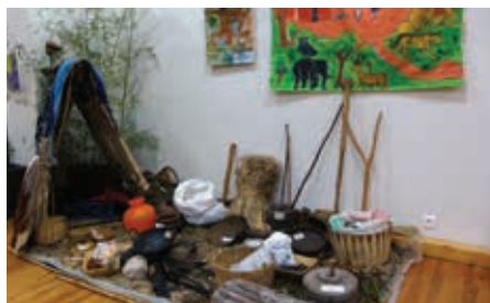
Hutte adivasi reconstituée et objets du quotidien