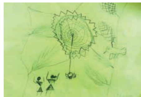
Dessin d'Aladin CM1-CM2, Ecole Les Mollières